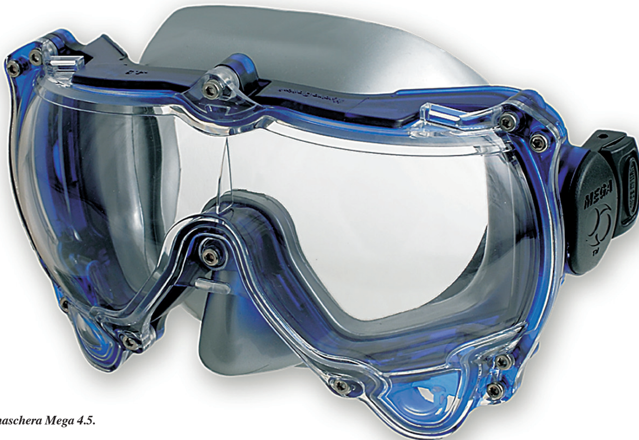
La maschera Mega 4.5.